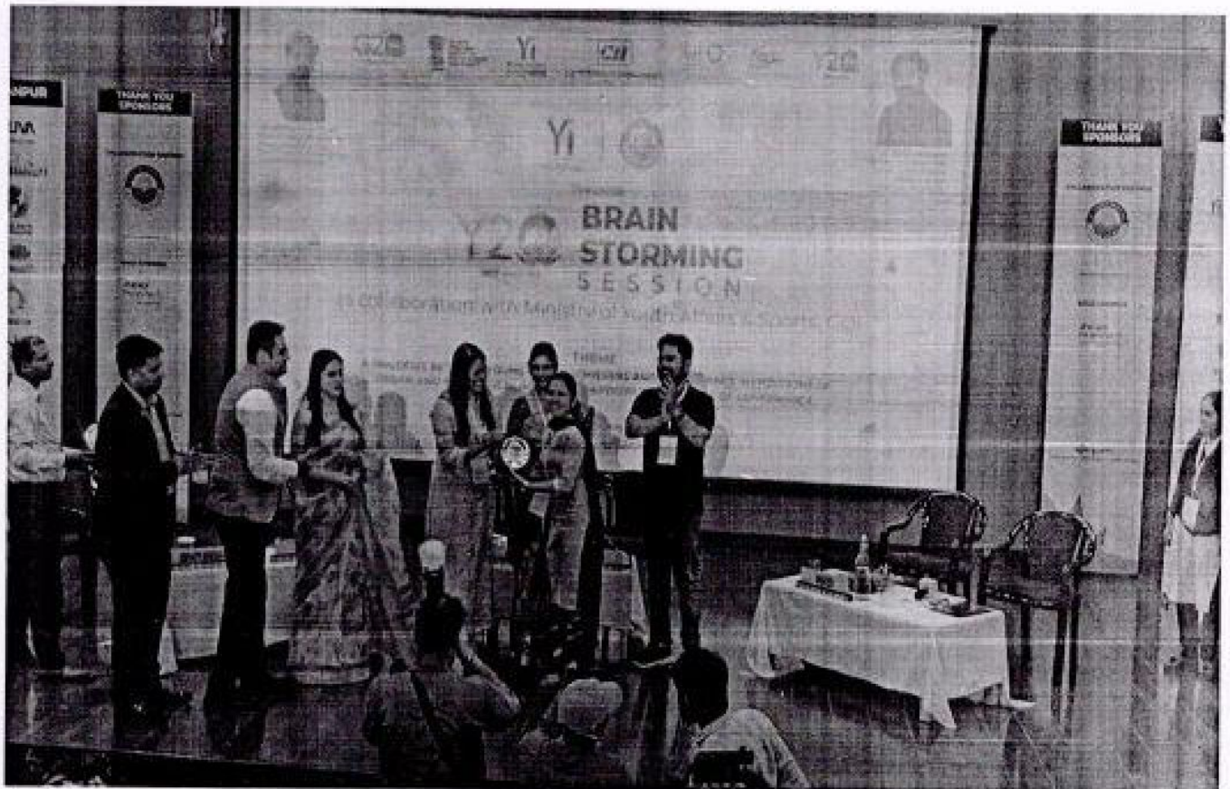
Brain Storming Session organized by CSJM University , Kanpur in collaboration with Ministry of Youth Affairs and Sports , Government Of India 2023