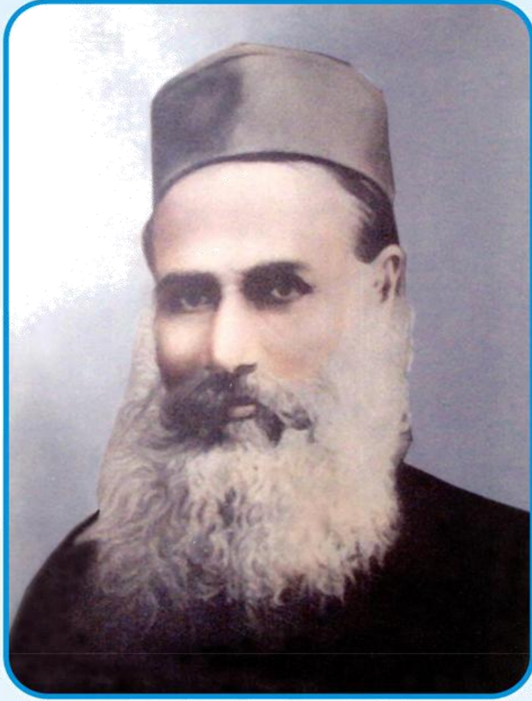
पं० पृथी नाथ चक (1858 – 1910)